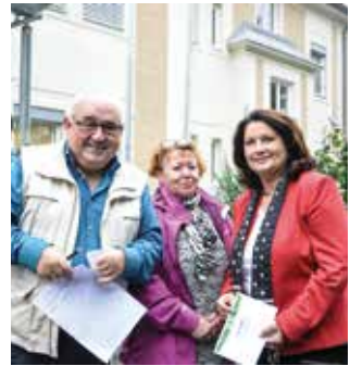
Unten und Rechts: Ausflug mit der Hilfgemeinschaft nach St. Georgen am Längsee