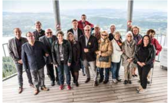
Oben und Links: Eröffnung der Aktion „OhrenBlicke“ auf dem Pyramidenkogel am 15.9.2017