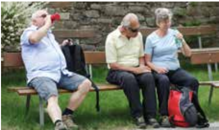
Kleine Rast vor der Kirche Fieberbrünnl in der Steiermark

Wie jedes Jahr wurde auch heuer wieder eine Wanderwoche veranstaltet. Weil es den Teilnehmern in den Vorjahren sehr gut gefallen hat, ging es erneut in die Gegend rund um den Stubenbergsee, wo man im Blindenheim Quartier nahm. Bei Vollpension und reichlich Pausen zum Verschnaufen erkundete unsere Wandergruppe die Gegend auf teilweise anspruchsvollen Routen.