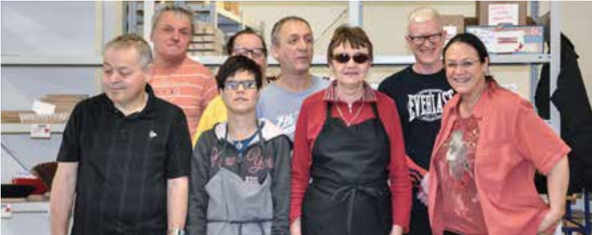
Das Team der ABC-Werkstätte im Jänner 2018