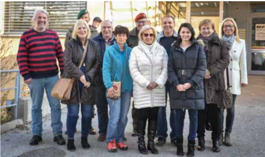
Eine Besuchergruppe kam Ende November 2017 vom Bundesheer mit Vertrauenspersonen für Menschen mit Behinderung im Dienst.

Es ist uns ein Anliegen, Kinder und Jugendliche für die Probleme von blinden und sehbehinderten Menschen zu sensibilisieren. Das geht am Besten im Rahmen des sogenannten Cafe im Dunkeln. 10 Mal servierten wir Kaffee und Kuchen an Schulklassen, Studenten, aber auch Firmen und Sozialeinrichtungen.